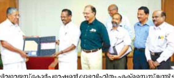
ബീവറേജസ് കോർപ്പറേഷന്റെ ലാഭവിഹിതം എക്സൈസ് മന്ത്രി ടി.പി. രാമകൃഷ്ണൻ മുഖ്യമന്ത്രി പിണറായി വിജയന് കൈമാറി.

തിരുവനന്തപുരം: കേരള സംസ്ഥാന ബീവറേജസ് കോർപ്പറേഷന്റെ ലാഭവിഹിതമായി ₹8.20 കോടി എക്സൈസ് മന്ത്രി ടി.പി. രാമകൃഷ്ണൻ മുഖ്യമന്ത്രി പിണറായി വിജയന് കൈമാറി. മുഖ്യമന്ത്രിയുടെ ചോഴർ ഡെപ്യൂട്ടി വിജയൻ കൈമാറി. മുഖ്യമന്ത്രിയുടെ ചോഴർ ഡെപ്യൂട്ടി വിജയൻ കൈമാറി.