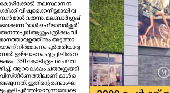
മാൾ ഒഫ് ട്രാവൻകൂറിന്റെ മാതൃക 3000 പേർക്ക് തൊഴിൽ മുറയ്ക്കുന്നതിലേക്ക് പേർക്ക് തൊഴിൽ ലഭിക്കുന്ന മാൾ ഒഫ് ട്രാവൻകൂറിൽ സരക്ഷയ്ക്കായി 1.25 ലക്ഷം കോടി രൂപയുടെ പുറംതൊഴിലുറപ്പ് പദ്ധതിയും പദ്ധതിയും അനുബന്ധമായി ഉൾക്കൊള്ളിച്ചിട്ടുണ്ട്.

ആയിരത്തിലേറെ വാഹനങ്ങൾക്ക് പാർക്ക് ചെയ്യാനുള്ള സൗകര്യവും ഉണ്ടായിട്ടുണ്ട്. മാതൃക സൗകര്യവും ഉണ്ടായിട്ടുണ്ട്. മാതൃക സൗകര്യവും ഉണ്ടായിട്ടുണ്ട്.