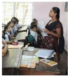
എയ്ഡഡ് സ്കൂൾ അധ്യാപകരുടെ പെൻഷൻ വിഹിതം