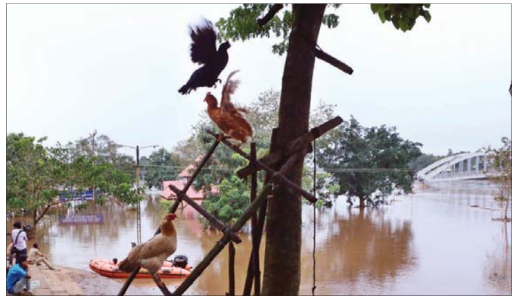
താഴെ വെള്ളം. മുകളിൽ ആകാശം! ഇടുക്കി, ഇടമലയാർ ഡാമുകൾ തുറന്നതോടെ വെള്ളത്തിന് ടിയിലായ ആലുവ മണലൂർത്ത് മഹാദേവ ക്ഷേത്രവും, കരിച്ചെത്തുന്ന വെള്ളത്തിൽ നിന്ന് രക്ഷതേടി സമീപത്തെ മരത്തിൽ അഭയം പ്രാപിച്ച കോഴികൾ