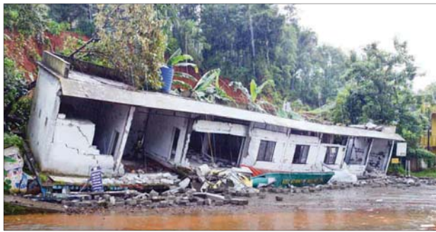
വെത്തിൽ പഞ്ചായത്ത് ബസ് സ്റ്റാൻഡ് കെട്ടിടം കാലവർഷത്തിൽ തകർന്ന നിലയിൽ