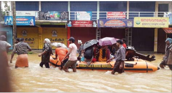
വയനാട് കായലിലെ ടൗണിൽ വെള്ളം കയറിയപ്പോൾ