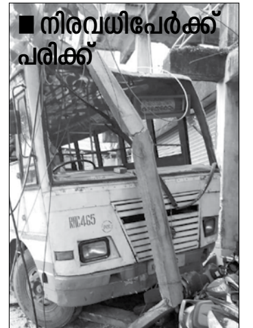
അമ്പലമുക്കിൽ ഓട്ടോയിൽ ഇടിച്ചശേഷം പോസ്റ്റിൽ ഇടിച്ചുനിന്ന ബസ്

തിരുവനന്തപുരം: അമ്പലമുക്കിൽ നിയന്ത്രണം വിട്ട കെ. എസ്. ആർ. ടി. സി ബസ് വൈദ്യുതി പോസ്റ്റിലിടിച്ചുണ്ടായ അപകടത്തിൽ പെട്ട ഇരുപതോളം പേർക്ക് പരിക്കേറ്റു. ഇന്ന് രാവിലെ ഒൻപതരയോടെ അമ്പലമുക്ക് കരിശിക്ക് സമീപമാണ് അപകടമുണ്ടായത്. പരിക്കുകൾ നിസാരമാണ്. പേരൂർക്കട ഭാഗത്ത് നിന്ന് വെള്ളയമ്പലത്തേക്ക് വരികയായിരുന്ന കെ. എസ്. ആർ. ടി. സി ബസാണ് അപകടത്തിൽ പെട്ടത്. അമിതവേഗത്തിലായിരുന്ന ബസ് മൂന്നിൽ പോയ ആട്ടോറിക്കുയിൽ ഇടിക്കുകയായിരുന്നു. ആട്ടോ സലൻ ബ്രേക്കിട്ടതിനെത്തുടർന്നാണ് പിന്നിലിടിച്ചത്. തുടർന്ന് നിയന്ത്രണം വിട്ട റോഡരികിൽ നിന്ന വൈദ്യുതി പോസ്റ്റിൽ ഇടിച്ചാണ് ബസ് നിന്നത്. പോസ്റ്റ് മറിഞ്ഞുവീണു. ഓഫീസ് സമയമായിരുന്നതിനാൽ ബസിൽ നല്ല തിരക്കായിരുന്നുവെന്ന് പൊലീസ് പറയുന്നു. അപകടത്തിന്റെ ആഘോഷത്തിൽ ബസിനുള്ളിൽ വീണാണ് യാത്രക്കാർക്ക് പരിക്കേറ്റത്. ആട്ടോറിക്കു ഡ്രൈവർക്കും പരിക്കേറ്റിട്ടുണ്ട്. ഇവരെ പേരൂർക്കട സർക്കാർ ആശുപത്രിയിൽ പ്രവേശിപ്പിച്ചു. അപകടത്തെത്തുടർന്ന് റോഡിൽ ഗതാഗതം തടസ്സപ്പെട്ടു. പേരൂർക്കട പൊലീസെത്തിയാണ് സ്ഥിതിഗതികൾ നിയന്ത്രണവിധേയമാക്കിയത്.