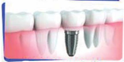
IMPLANT DENTISTRY നഷ്ടപ്പെട്ട പല്ലുകളെ താടിയെല്ലുകളോട് ഘടിപ്പിക്കുന്ന ആധുനിക ചികിത്സാരീതി