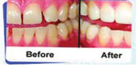
ACCELERATED ORTHODONTICS അതിവേഗത്തിൽ ദന്തക്രമീകരണ ചികിത്സാരീതി