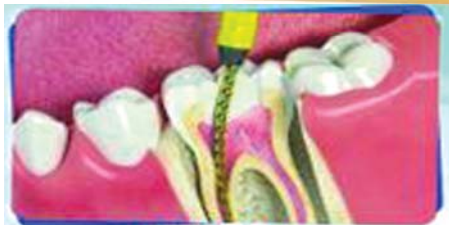
ROOT CANAL പല്ലുവേദന അകറ്റി പല്ലിന്റെ വേരുകൾ പല്ലിനെ സംരക്ഷിക്കുന്ന ചികിത്സാരീതി