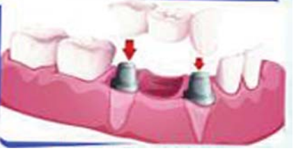
CROWN & BRIDGE നഷ്ടപ്പെട്ട പല്ലുകൾക്കു പകരം ഉറപ്പുള്ളതും സ്ഥിരവുമായ പല്ലുകൾ ഘടിപ്പിക്കുന്ന ചികിത്സാരീതി