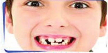
PEDODONTICS കുട്ടികളുടെ ദന്തസംരക്ഷണത്തിനുള്ള ചികിത്സാരീതി