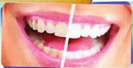
TEETH WHITENING നിറമങ്ങിയ പല്ലുകളെ ബ്ലീച്ച് ചെയ്ത് വെളുപ്പിക്കുന്ന ചികിത്സാരീതി