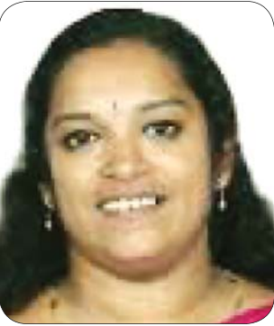
സ്വിച്ച് ഓൺ കർമ്മം രാവീരവികുമാർ ബഹു. ഡെപ്യൂട്ടി മേയർ