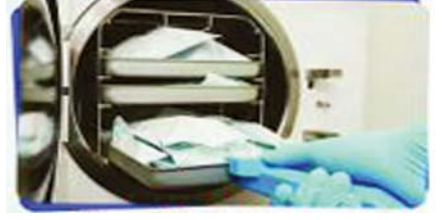
INSTRUMENT STERILIZATION 100% അണുവിമുക്തമാക്കിയ ഉപകരണങ്ങൾ ഉപയോഗിക്കുന്നു