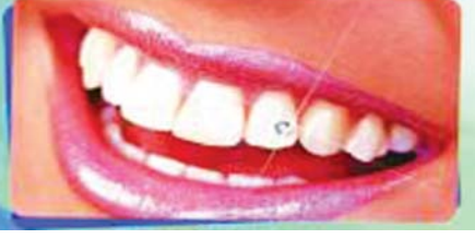
TOOTH JEWEL ചിരിക്ക് അഴക് കൂട്ടാൻ ജുവലുകൾ പല്ലുകളിൽ ഘടിപ്പിക്കുന്ന രീതി