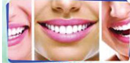
SMILE DESIGN നിങ്ങളുടെ ചിരിക്ക് അഴക് കൂട്ടുവാനുള്ള ആധുനിക ചികിത്സാരീതി