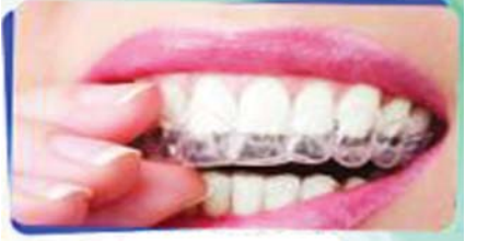
INVISALIGN നിരന്തരമായതും ഉന്തിയതുമായ പല്ലുകളെ കമ്പിയിടാതെ ശരിയാക്കുന്ന ചികിത്സാരീതി