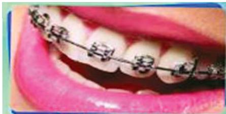
ORTHODONTICS നിരന്തരമായതും ഉന്തിയതുമായ പല്ലുകളെ കമ്പിയിട്ട് ശരിയാക്കുന്ന ചികിത്സാരീതി