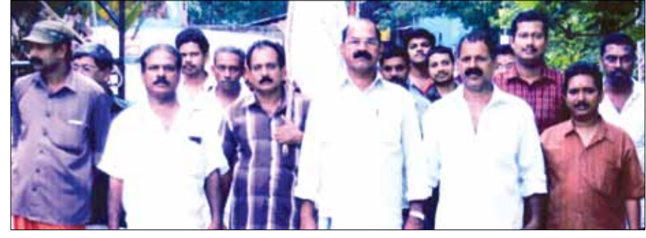
വ്യാപാരി വ്യവസായി ഏകോപന സമിതി മാനന്ദ്യർ യൂണിറ്റ് കെ.എസ്.ഇ.ബി.മാനന്ദ്യർ ഓഫീസിലേക്ക് നടത്തിയ മാർച്ച്

തിരുവനന്തപുരം: കേരള പൊലീസ് അസോസിയേഷൻ്റെ 34-ാം സിറ്റി ജില്ലാ സമ്മേളനം ഇന്ന് മുതൽ 27 വരെ നടക്കും. സമ്മേളനത്തോടനുബന്ധിച്ച് കലാകായിക മത്സരങ്ങൾ, ക്ലബ്ബ് സമ്മേളനം, പ്രതിനിധി സമ്മേളനം, പൊതുസമ്മേളനം എന്നിവ സംഘടിപ്പിച്ചിട്ടുണ്ട്. ഇന്ന് കലാകായിക മത്സരങ്ങൾ നടക്കും. നാളെ പാളയം പൊലീസ് ക്ലബ്ബിൽ സംഘടിപ്പിച്ചിരിക്കുന്ന ക്ലബ്ബ് സമ്മേളനം ചെറുപുഴയിൽ നടക്കും. നാളെ പാളയം പൊലീസ് ക്ലബ്ബിൽ സംഘടിപ്പിച്ചിരിക്കുന്ന ക്ലബ്ബ് സമ്മേളനം ചെറുപുഴയിൽ നടക്കും.