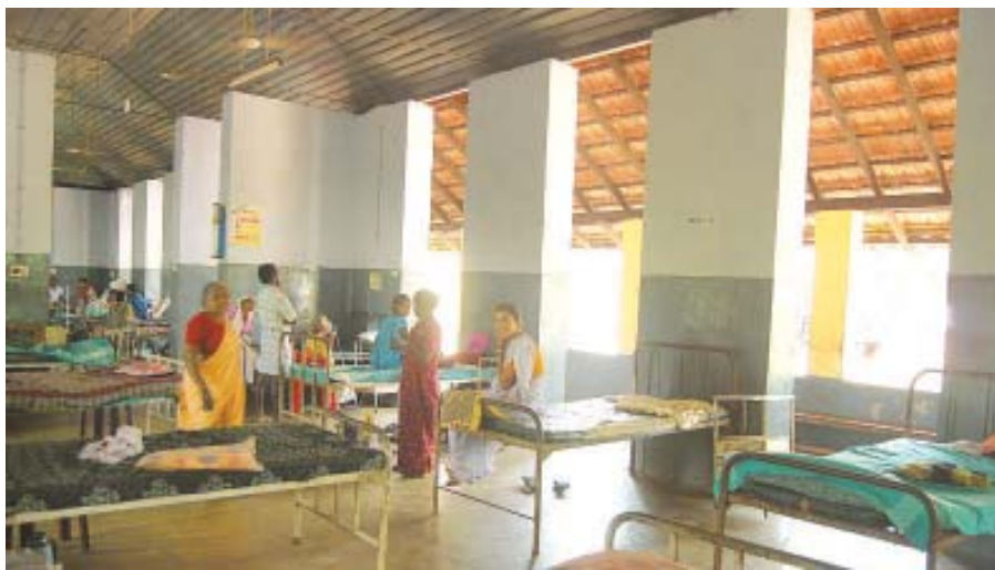
പുലയനാർകോട്ട ആശുപത്രിയിലെ സ്ത്രീകളുടെ ഒരു വാർഡ്

തിരുവനന്തപുരം: ജനലും വാതിലുമില്ലാത്ത തുറന്നുകിടക്കുന്ന ആർക്കും എപ്പോഴും കടന്നുചെല്ലാം. ആരും തടയില്ലാ- പുലയനാർകോട്ട ക്ഷയരോഗാശുപത്രിയിലെ സത്രീകളുടെ വാർഡിന്റെ അവസ്ഥയാണിത്. തുറന്നുപോയ ഹാളുകളിലാണ് ഇവിടെ സ്ത്രീകളെ കിടത്തി ചികിത്സിക്കുന്നത്. തീരെ അവശരായ രോഗികൾ വരെ ഇക്കൂട്ടത്തിലുണ്ട്. മഞ്ഞയാലും മഴയാലും സഹിക്കുകതന്നെ. തങ്ങൾക്ക് ഒരു സുരക്ഷയും ലഭിക്കുന്നില്ലെന്ന് രോഗികൾ പറയുന്നു.